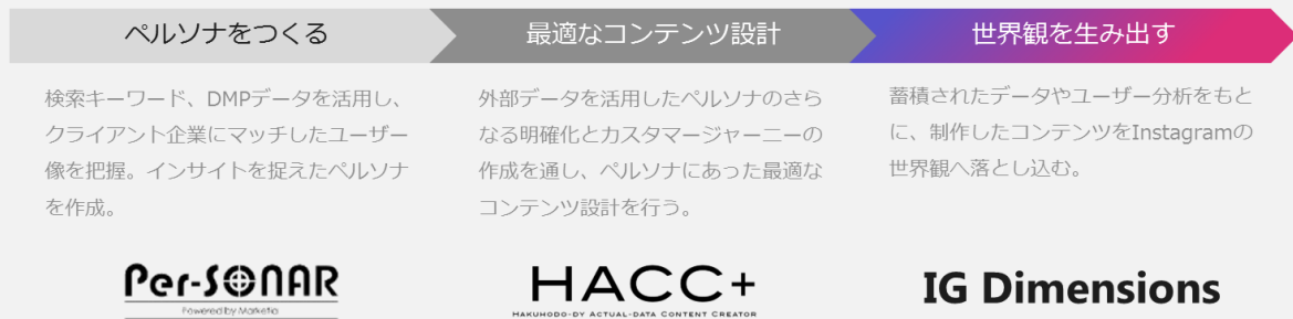
図1：「Social Dig Visual」サービス概要

「Social Dig Visual」は、まず「Per-SONAR」で可視化したコンバージョンユーザーのWeb行動データから、ペルソナやインサイトを発見し、商品・サービスとマッチする複数のペルソナの設定を行います（図2）。