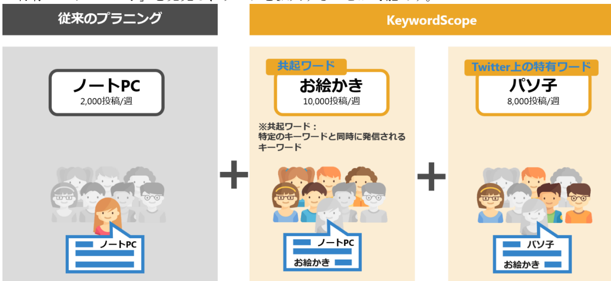
図 1 : KeywordScope (キーワードスコープ) によるキーワードの捉え方

例えば「ノート PC」というキーワードでターゲティングする場合、一般的なキーワード「ノート PC」では約 2,000 投稿がターゲティング対象となるが、KeywordScope (キーワードスコープ) を活用することにより、約 10,000 件投稿ある共起ワード「お絵かき」や、約 8,000 投稿ある Twitter 上の特有ワード「パソ子」を発見し、リーチを拡大することが可能です。