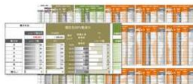
(2) 訪問・期間ごとの成果推移 ※Excelファイル