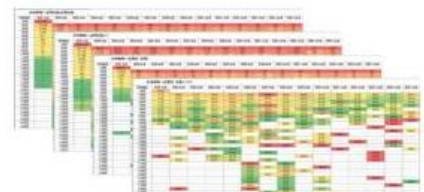
(3) 訪問×訪問日間隔・利用期間マトリックス ※Excelファイル