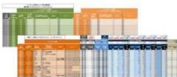
(1) 成果履歴 ※Excelファイル