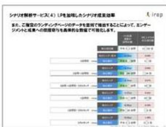
(4) 指定のLP分析レポート ※PowerPointファイル