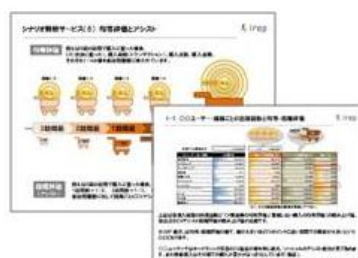
(5) 均等・アシスト評価レポート ※PowerPointファイル